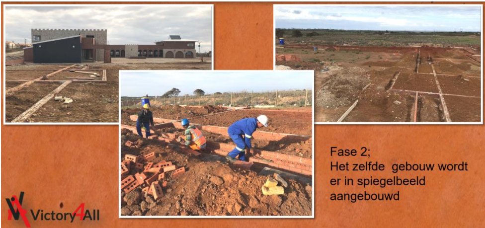
Fase 2; Het zelfde gebouw wordt er in spiegelbeeld aangebouwd