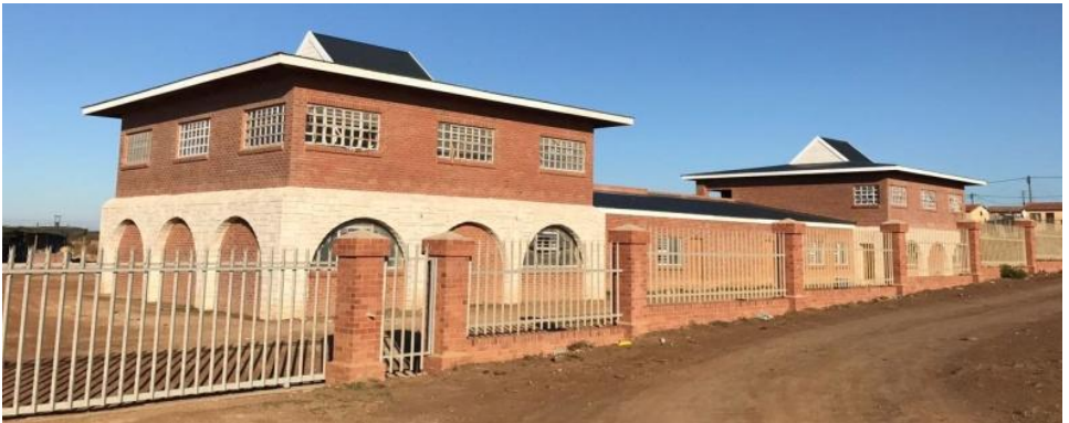
Voorkant van de nieuwbouw, eerste fase.